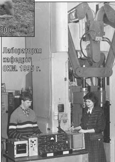
Лаборатория кафедры ОКМ, 1995 г.

Госкомитет РФ по высшему образованию изменил статус рыбинского вуза. Отныне он стал именоваться Рыбинской государственной авиационной технологической академией.